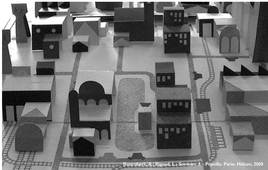
Boisrobert, A.; Rigaud, L.; Sorman, J. - Popville. Paris: Hélicium, 2009

As cidades são locais pensados e construídos para as pessoas.