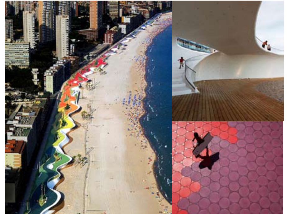
Paseo Marítimo de la Playa Poniente Benidorm [Espanya], 2009

La inserció d'un pavelló teatral dinamitza programàticament la plaça de la catedral de Laurenskerk i articula la seva relació amb el canal de Delftsevaart.