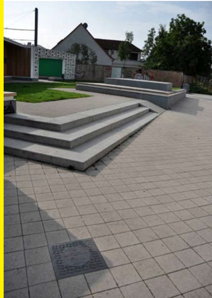
La placa del Premi està col·locada davant de l'Open-Air-Library a Magdeburg.