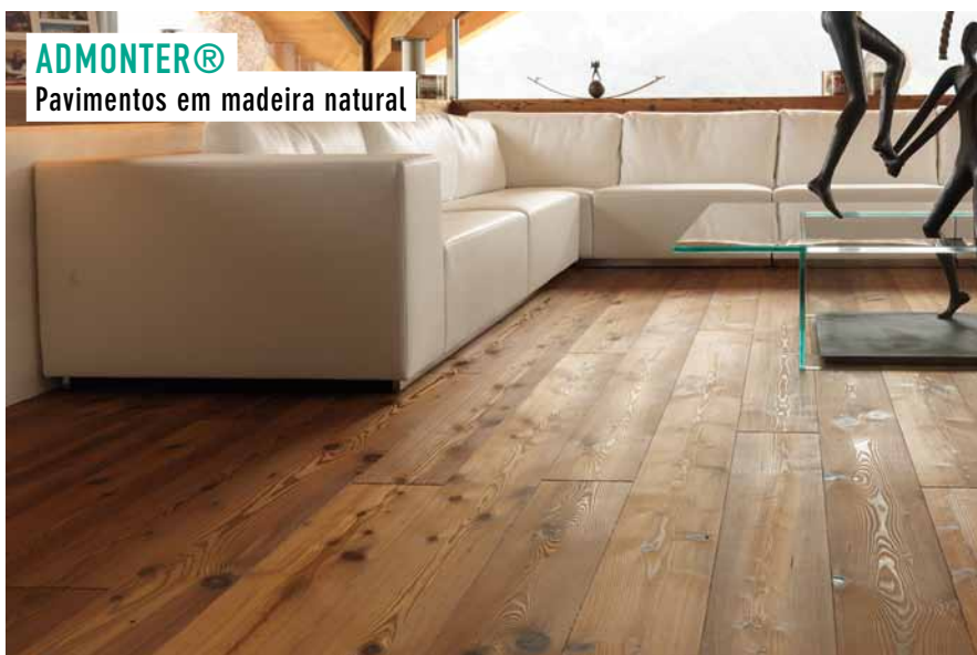
Pavimento em larix, ref.º Antico Larix Marrone

Admonter® inclui 20 espécies de madeira, mais de 100 cores em diferentes dimensões e acabamentos. Os pavimentos Admonter® destacam-se pela diversidade no design, na naturalidade e nos elevados padrões de qualidade nas suas oito linhas de produtos. Conheça as coleções XEIS, DESIGN EDITION, ANTICO, MOCCA, CLASSIC HARDWOODS, CLASSIC SOFTWOODS, CITYFLOOR e, em especial XXLONG, que oferece dimensões de pavimentos até 325 mm de largura e comprimento de 5 metros.